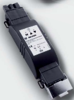
Sonnen-Vario-Set SVS241-II Handsender mit Funkempfänger